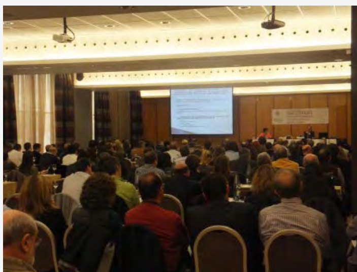
Les jornades se celebren fins divendres a l'Hotel Ciutat de Tarragona. Fins al 2011 s'havien organitzat a la Ciutat de Repos i Vacances